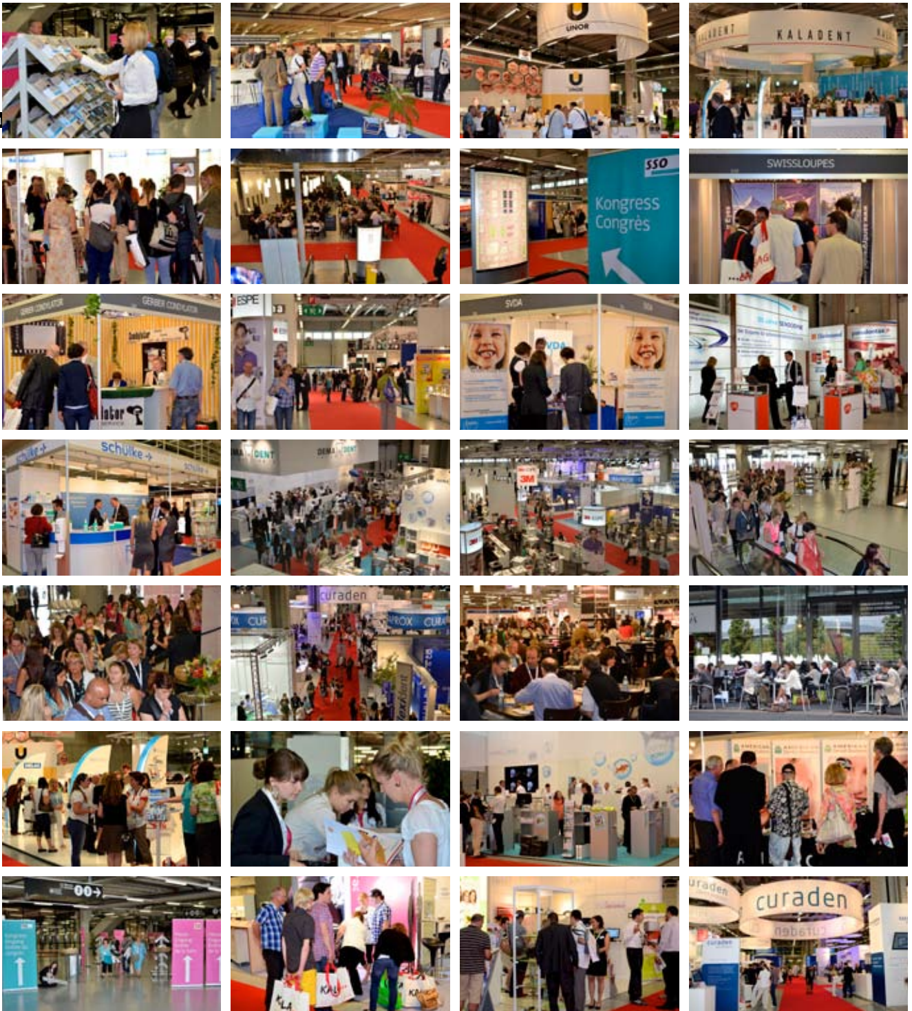
IMPRESSIONEN DENTAL 2018